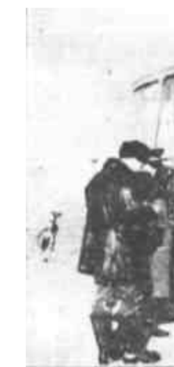
※ 本版编辑 丁海螺 ※