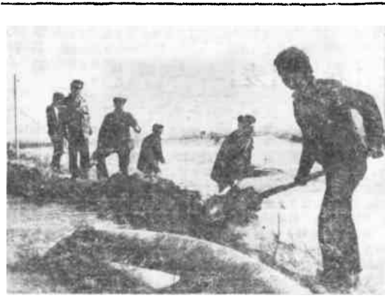
东营区六户镇地处贫水区，从正月初五起，麦田近万亩。员干部、村民300余人，抢灌麦地。日前，已灌溉

在改革开放的新形势下，如何保持党和政府的清正廉洁，是一个带根本性、全局性的问题。近一个时期以来，全国上下在思想教育和组织措施上采取了一系列强有力的措施，即充分表明了党和国家解决不正之风和腐败现象的决心和信心。