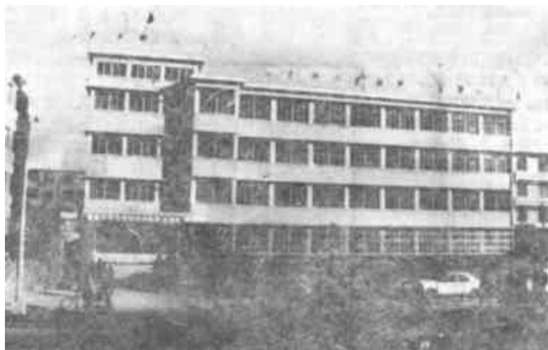
集宣传、培训、技术和药具服务于体的广饶县计划生育服务中心大楼于元月27日开业。图为大楼外景。